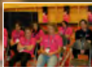
Sheffield EM-kisat Miesten ja naisten joukkueet Englannissa