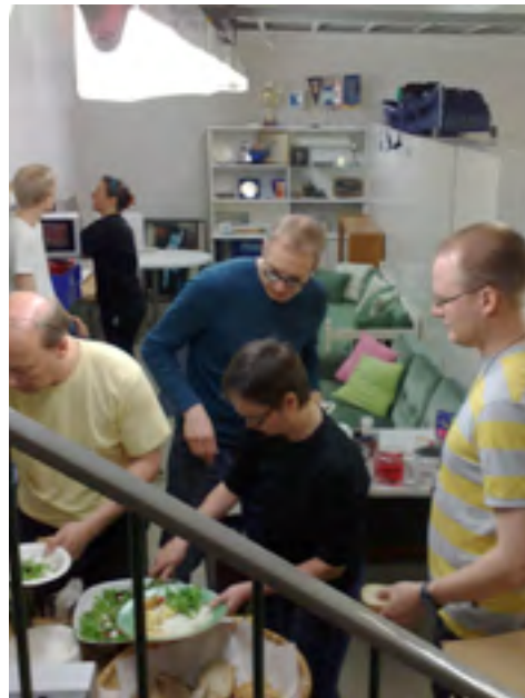
Talkootarjonta maistui tekijöille