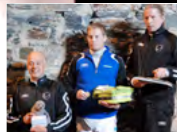
Miesten floretti 40v