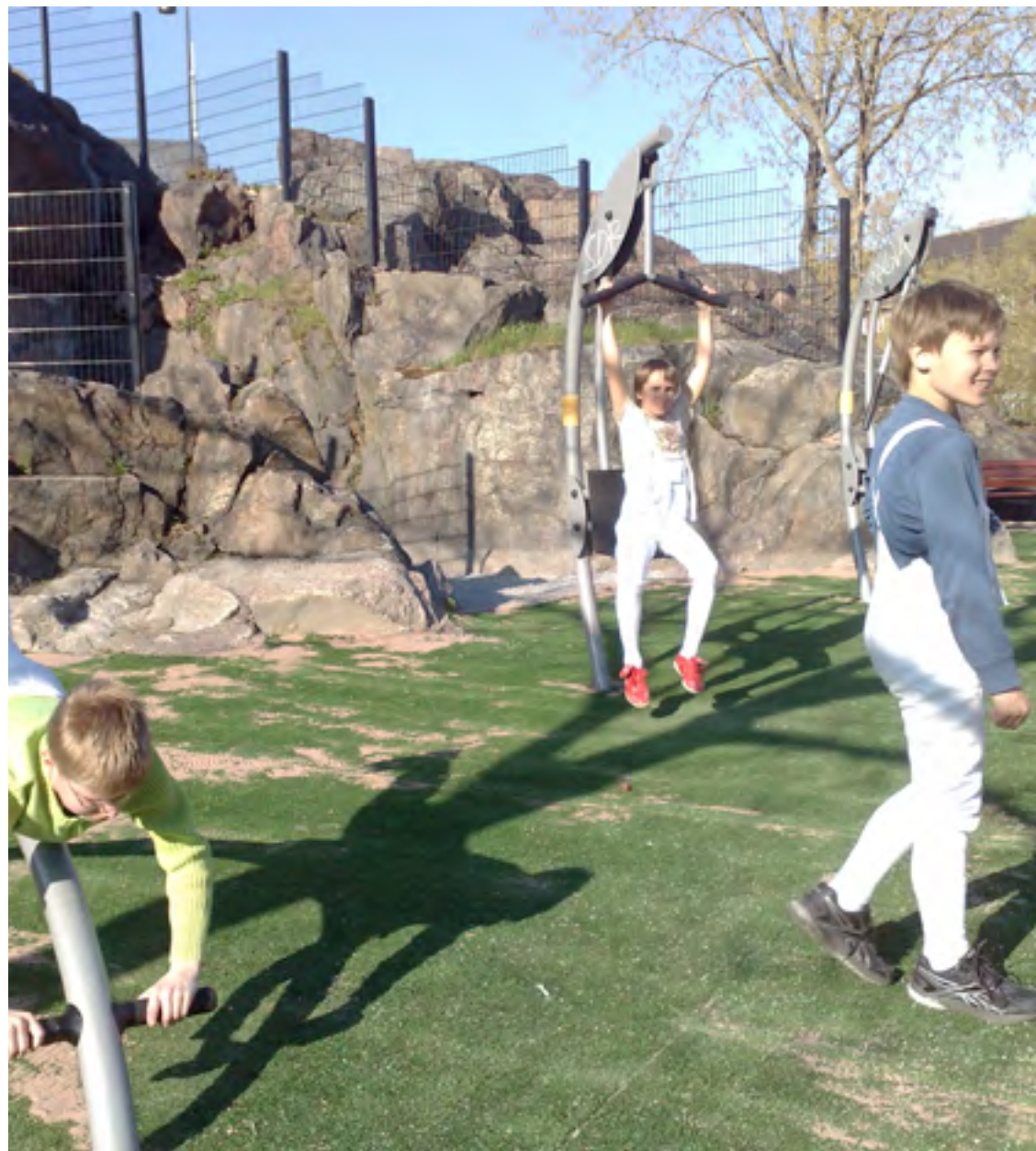
HFM-junnuja ulkona "ottamassa lämpöä"

Suhteellisen säännöllinen treenaus tietysti muuttaa arkirutiineja mukavasti, 3-4 kertaa viikossa on salilla tullut käytyä. Harrastuksen alussa jo huomasin, että ihan silloisella kunnolla ei pärjännyt, joten aloitin kevyet 2-3 kilometrin aamulenkit ja sen kautta on tullut ehkä vähän lisää kestävyttäkin.