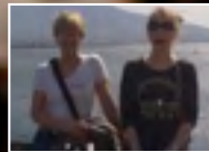
Naisten kalpa Eurooppa Cup Vesuviuksen lumossa Napolissa