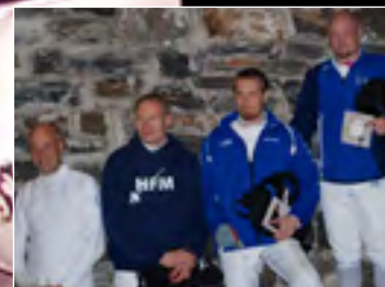
Miesten kalpa 40v

HFM:lle tuli hyvä mitalisaalis. Rovaniemi otti hieman yllättäen miesten floretin joukkue-mestaruuden. He ehkä halusivat sitä tällä kertaa enemmän.