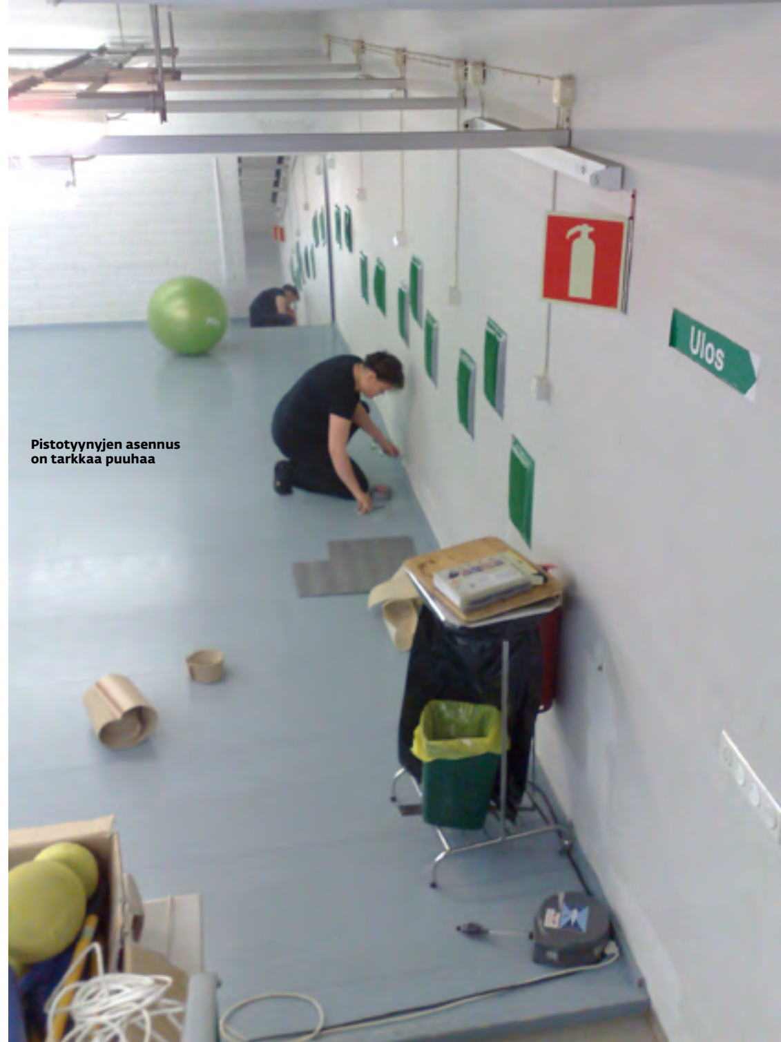
Pistotyynyjen asennus on tarkkaa puuhaa