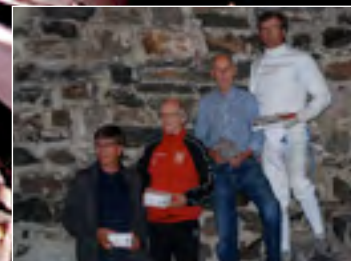
Miesten kalpa 50-60v