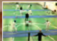
Kisatuloksia vuodelta 2011 Miekkailukisat ja turnaukset