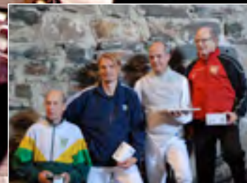
Miesten floretti 50-60v