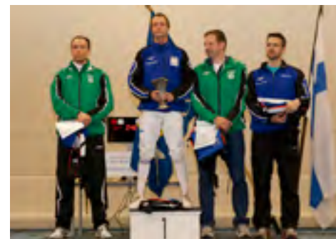
Naisten kilpailun mitalistit ja Miesten kilpailun mitalistit